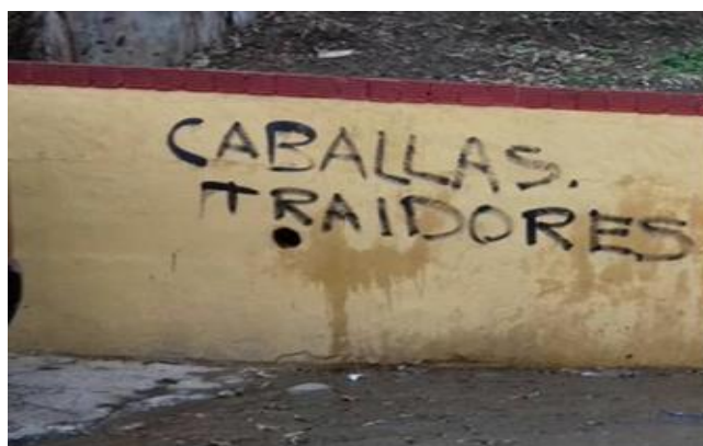
Fig. 5

El Príncipe se ha convertido progresivamente en un enclave donde se concentran las minorías, marroquíes por un lado y españoles de origen marroquí por el otro. La inscripción mural que presentamos a continuación puede interpretarse como una reacción e incluso, una acción permitiendo intensificar el sentimiento de exclusión, la no-ciudadanía de los residentes del barrio todo ello vehiculado a través del recurso a la amenaza y a la agresividad. Considerados frecuentemente como diferentes por sus orígenes pero también por el barrio en el que viven, algunos habitantes del Príncipe toman consciencia de esta diferencia y se adueñan de los muros para denunciar el racismo galopante del que se sienten víctimas.