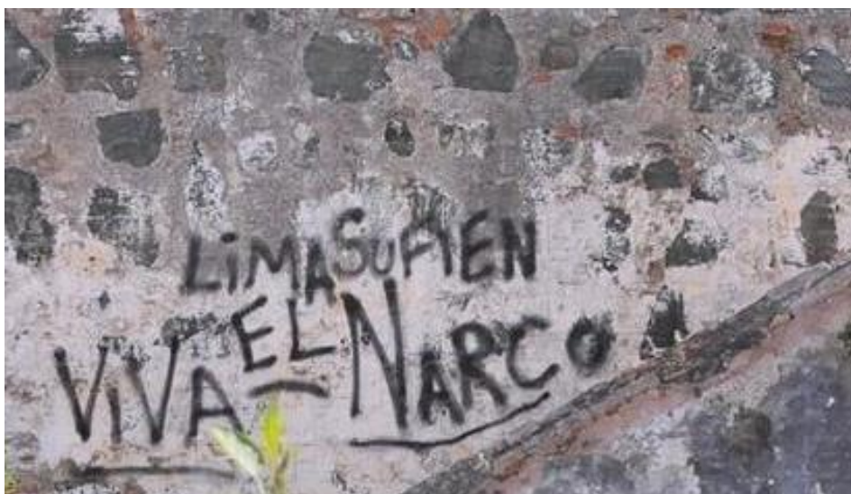
Fig. 16