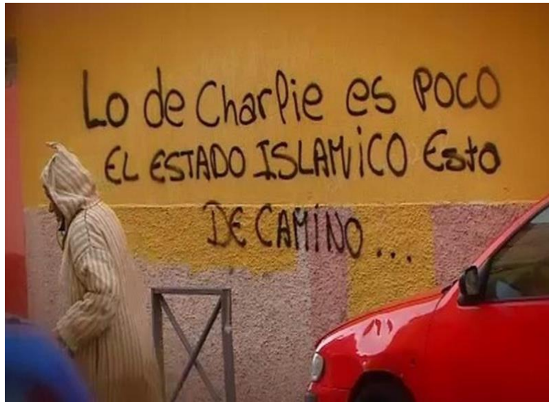
Fig. 9 © ABC 42