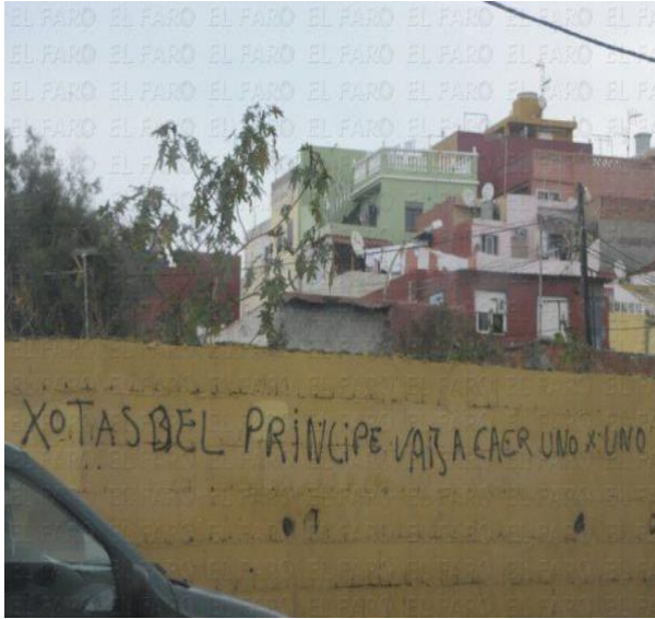
Fig. 14

En el Príncipe, algunas inscripciones como “Muerte a los chotas”, “Chotas No” o “Si hablas estás muerto” reiteran y nos recuerdan que el silencio constituye una regla de conducta, un principio esencial que nadie debe olvidar bajo pena de ver amenazada su existencia.