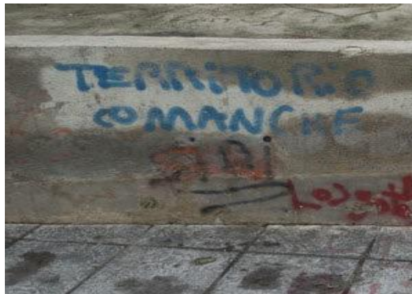
Fig. 4

El barrio del Príncipe padece de una imagen pública negativa que lo vincula directamente con la violencia, la inseguridad e incluso la miseria. Lejos de los eufemismos de las autoridades que niegan su abandono 34 , y que prefieren ver un barrio donde existen varias “problemáticas” 35 , los mismos habitantes, pese a su arraigo y afecto por el barrio, lo califican de manera habitual de “gueto”, de “polvorín” cuando no lo describen como un “territorio comanche”, lo que podemos traducir como territorio enemigo tal y como lo vemos reflejado en el siguiente tag, es decir, un territorio fuera de la ley.