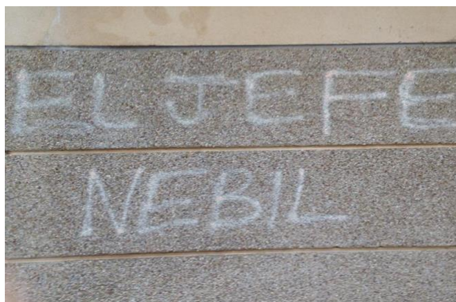
Fig. 13

Ciertas siglas, ciertos acrónimos y referencias biográficas, muy presentes en las fachadas rebeldes del Príncipe, tienen como finalidad reforzar el ambiente misterioso que reina en el barrio en donde la presencia de los “capos” de la droga y de sus cohortes está bastante difundida. Los tags contribuyen de este modo a la perpetuación de una “comunidad del miedo” al materializar los conflictos y rivalidades entre capos y bandas rivales 45 . Es el caso de la inscripción mural que presentamos a continuación en la encontramos un ejemplo de propaganda narco con la batalla por el liderazgo: se desvela públicamente la identidad del nuevo capo así como su autoridad.