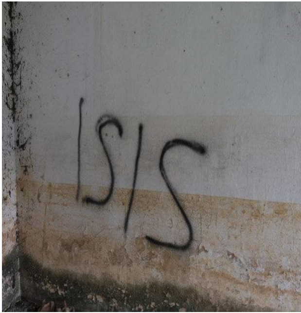
Fig. 7