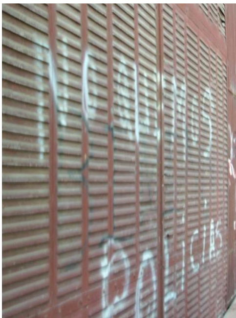
Fig. 12 © Alicia Fernández García