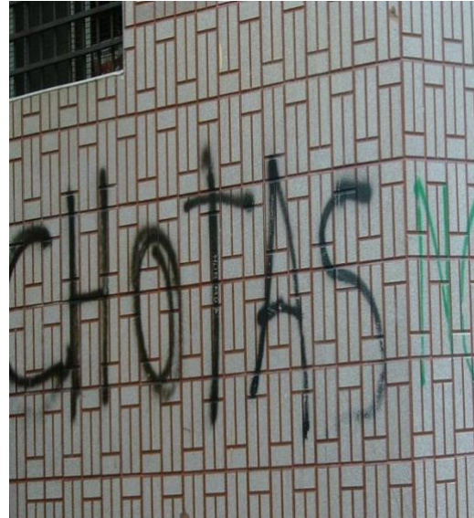
Fig. 15

Estas pintadas expresan igualmente cómo sobrevivir gracias al tráfico de la droga se ha convertido en una perspectiva deseable, a veces la única para buena parte de la población del barrio y, por ello, las expresiones murales narcos que se han implantado poco a poco en el paisaje urbano del barrio no hace nada sino desvelar una realidad socioeconómica bien conocida. Prueba del peso de esta economía paralela que constituye el tráfico de drogas, el tag que presentamos a continuación atesta e inmortaliza el alcance y la viveza de dicho fenómeno socioeconómico por no decir la única alternativa para ganarse la vida en el Príncipe.