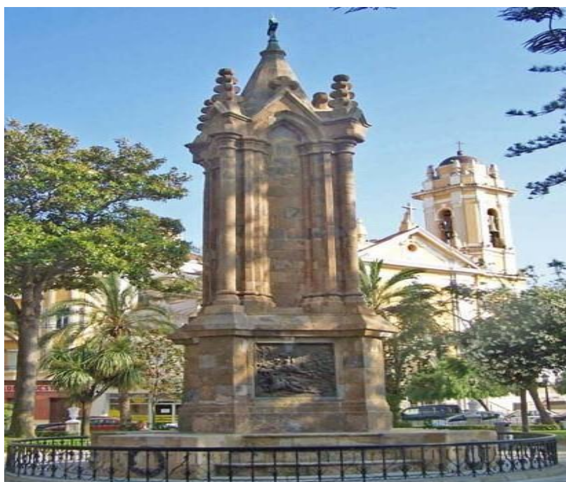
Fig. 1. Monumento conmemorativo de la Guerra de África (1859-1860)

A modo de ejemplo diremos que, en Ceuta, la arquitectura conmemorativa de los éxitos militares, tan apreciada en esta ciudad, encuentra su mejor huella en el monumento consagrado a los héroes de la primera guerra de África (1859-1860) 14 . Una guerra glorificada en la ciudad pero que alberga en el imaginario colectivo español, un recuerdo bastante amargo 15 . El lugar escogido fue la actual Plaza de la Constitución, antes llamada Plaza de Nuestra Señora de África, centro neurálgico de la ciudad en donde se encuentran las sedes de los tres poderes locales: el ayuntamiento, cuna del poder civil; la Comandancia general, sede del poder militar y la Catedral, pilar del poder religioso.