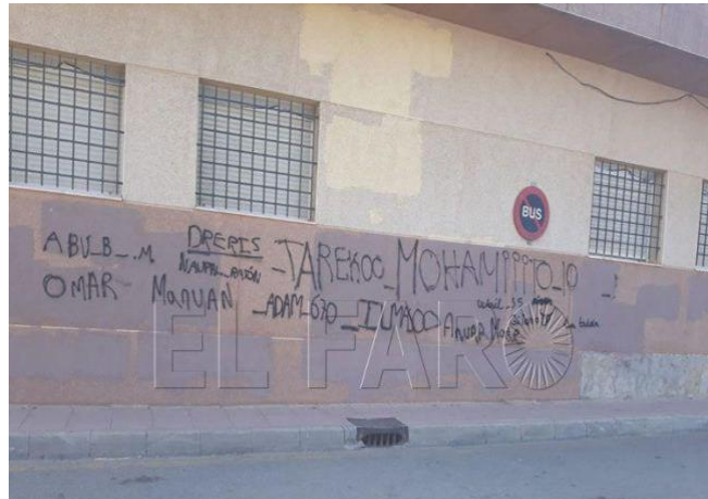
Fig. 3 33

El barrio del Príncipe padece de una imagen pública negativa que lo vincula directamente con la violencia, la inseguridad e incluso la miseria. Lejos de los eufemismos de las autoridades que niegan su abandono 34 , y que prefieren ver un barrio donde existen varias “problemáticas” 35 , los mismos habitantes, pese a su arraigo y afecto por el barrio, lo califican de manera habitual de “gueto”, de “polvorín” cuando no lo describen como un “territorio comanche”, lo que podemos traducir como territorio enemigo tal y como lo vemos reflejado en el siguiente tag, es decir, un territorio fuera de la ley.