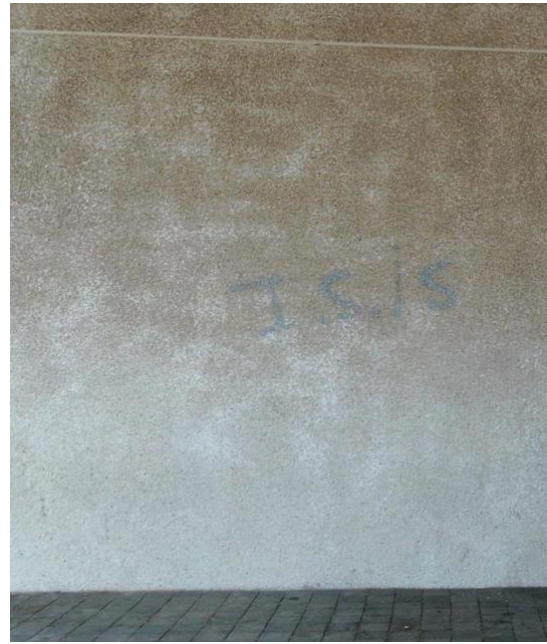
Fig. 8 © Alicia Fernández García

De igual modo, la propaganda yihadista toma la forma de insultos e intimidaciones anticristianos tal y como lo vemos reflejado en el recurso a expresiones tales y como “Infieles de mierda” o “Nuestro profeta sigue existiendo” que hemos encontrado pintadas en algunas fachadas cercanas a iglesias o a la cofradía de franciscanos de la Cruz Roja. Estas inscripciones en favor del Estado islámico, además de aterrorizar a la ciudad, aumentan la tensión social y crean una atmósfera en donde la psicosis y la desconfianza son palpables. Inscripciones que reactivan y reaniman las presiones comunitarias e imponen una nueva parrilla de análisis, la del “choque de civilizaciones”, al mismo tiempo que contribuyen a plasmar una realidad fantaseada como es la de un barrio e incluso toda una ciudad atormentada por no decir presa de una guerra de religiones. Así, el proselitismo religioso expuesto en los muros del barrio del Príncipe se aleja a menudo de su función primera como es el reclutar adeptos y adopta un matiz revanchista 41 .