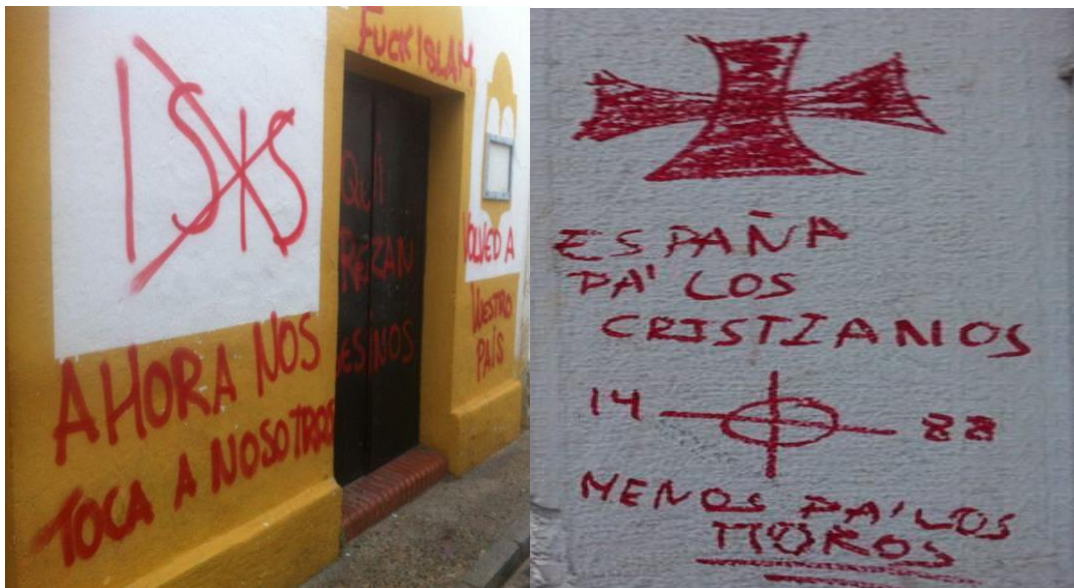
Fig. 10

La lógica del “en contra de los otros” se ha visto reforzada en Ceuta como lo manifiestan estas inscripciones que se alzan en ejemplos de la intolerancia fundamentalista imperante. El rechazo del otro, esta vez de los musulmanes, expresado en el tag que aquí arriba presentamos muestra cómo detrás de la reivindicación de un compromiso o fervor religioso se esconde en realidad el