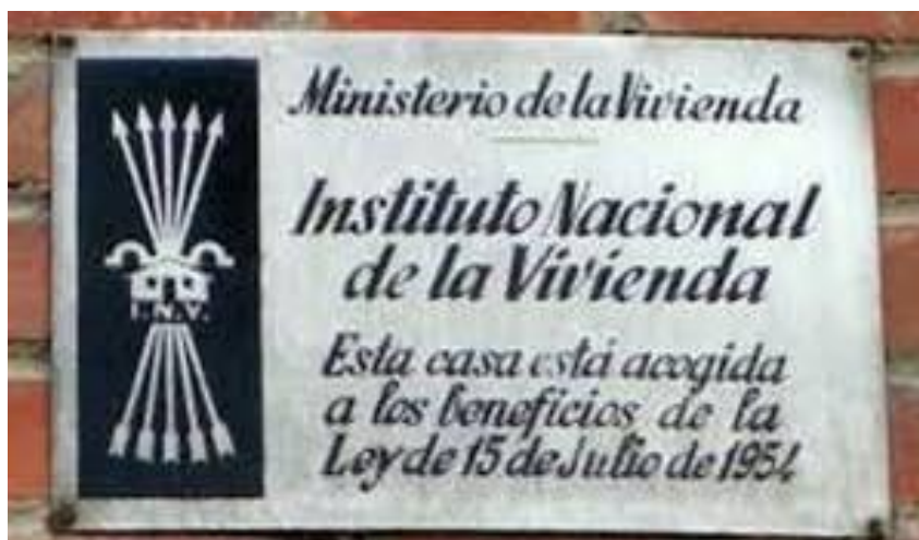
Fig. 2. El yugo y las flechas falangistas

En la actualidad, el ayuntamiento de Ceuta, dirigido por el conservador Juan Jesús Vivas, continua sin respetar la Ley de Memoria histórica por lo que dicha ciudad sigue contando con un número importante de símbolos franquistas en sus calles. Citaremos a este respecto cómo el recuerdo del levantamiento militar y de la dictadura está presente en la toponimia urbana como lo muestra por ejemplo la calle dedicada a “Joaquín García Morato”, uno de los más importantes aviadores del Ejército nacional. A la entrada del edificio del hospital militar O’Donnell de Ceuta, una placa conmemora aún en nuestros días a los jefes y oficiales franquistas muertos durante la guerra civil 21 . Otro símbolo franquista se encuentra dentro del cuartel teniente Ruiz, en donde podemos leer encima de uno de sus escudos en yeso el eslogan falangista: “Una, grande y libre” 22 . Igualmente, en el Instituto Nacional de la Vivienda del ejército, las flechas y el yugo falangista siguen dando la bienvenida a los visitantes 23 . Una toponimia urbana ampliamente identificada con el pasado franquista y con el militarismo y fuertemente politizada ya que metafórica una concepción exclusivista de la nación.