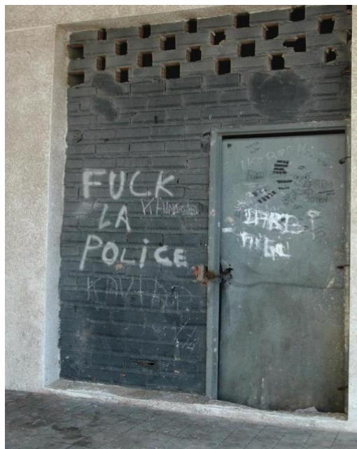
Fig. 11

Otro registro iconográfico bastante difundido en las paredes del barrio da testimonio de la existencia de una memoria conflictiva y de las tensas relaciones mantenidas con las autoridades y las instituciones locales. Percibidos como los guardianes de un sistema juzgado autoritario y que menosprecia a los musulmanes de Ceuta, el odio hacia la policía y toda fuerza del orden está ampliamente presente en las fachadas del barrio. El recurso sistemático a la conjunción negativa “No” tal y como lo vemos expresado en la pintada “No queremos policía” aquí abajo expuesta así como el uso del campo semántico del menosprecio y del rechazo con el empleo de verbos tales y como “fuera”, “fuck”, “me cago en” para referirse a las fuerzas del orden, son algunos de los signos de la relación problemática existente entre la policía y los habitantes.